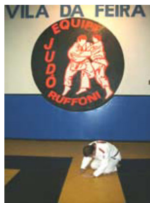
ZAREI - sentado de joelhos no solo