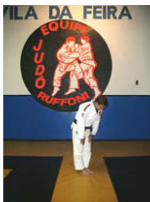
RITSUREI - de pé