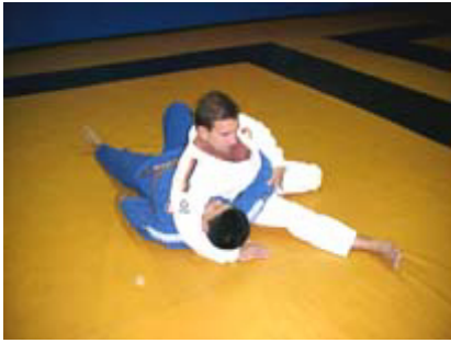
HON KESA GATAME