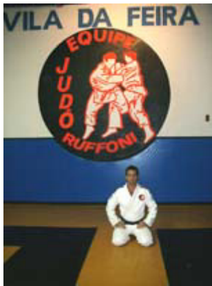
SEIZA - ajoelhado