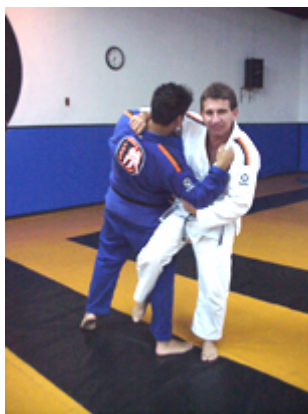
O SOTO GARI