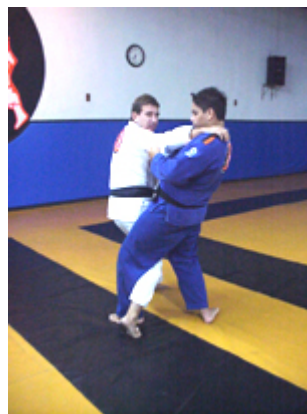
O UCHI GARI